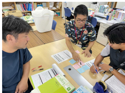
一人一公開授業後のリフレクションの様子。教頭先生も入っている光景です。