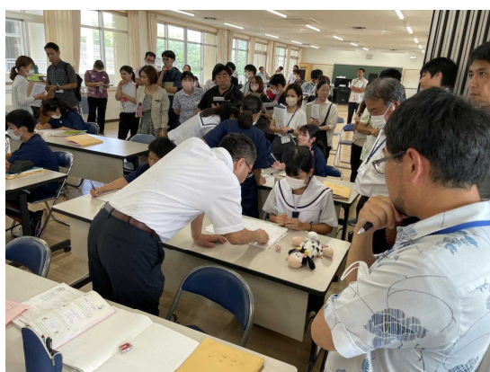
午後の公開授業より。意図的な机間指導で、子どもやる気を促す。