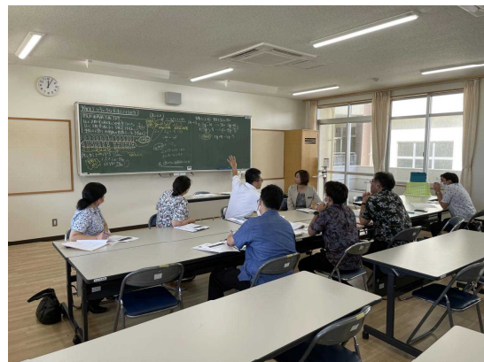
示範授業の板書をもとに、授業リフレクション。数学教科会で活発な意見交換が行われました。