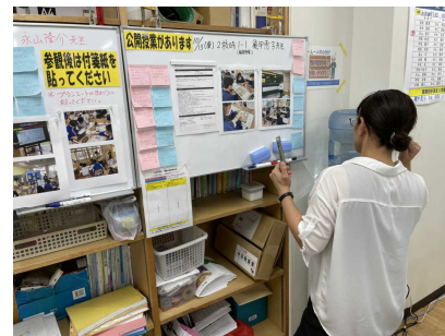
公開授業後に感想が書かれた付箋を見ながら、自身の授業を振り返る。