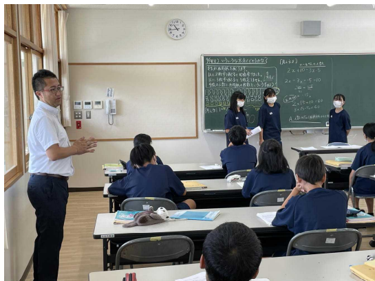
示範授業より。生徒の発表のときの教師の立ち位置が重要。聞き手側の生徒の表情から理解状況を見取る。

午前中は示範授業の後、大里中学校数学科が同じ内容の授業(再現授業)を行い、午後からの公開授業並びに講演会には島尻地区内の小中学校の先生方50名余りが参加しました。